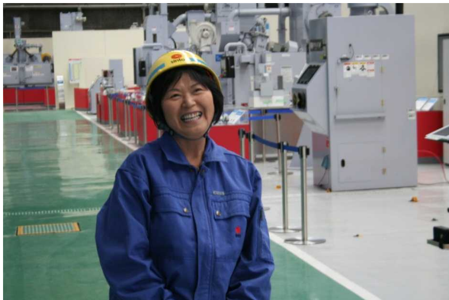
商品体感センター内の美化