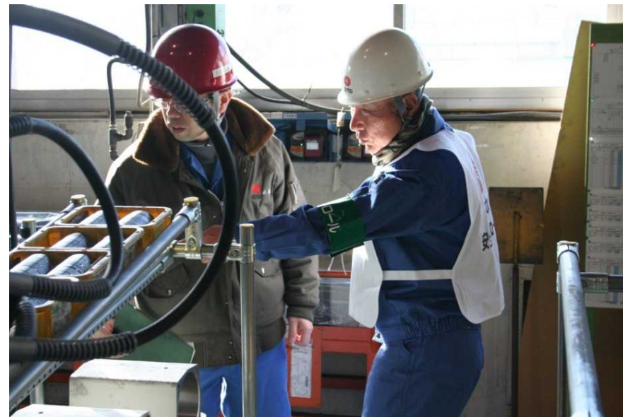
職場安全パトロール