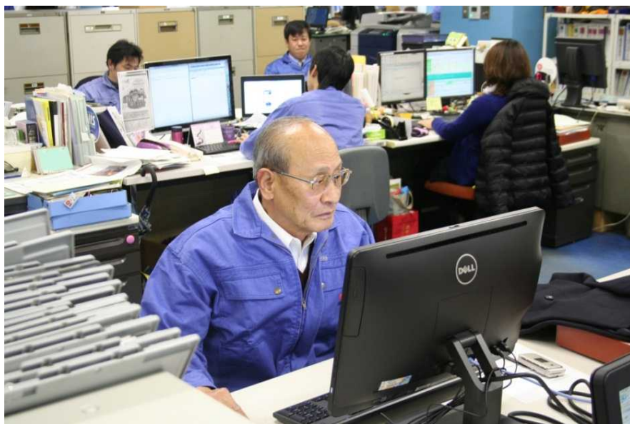
顧客情報のメンテナンス